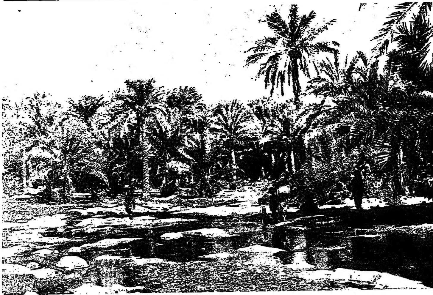
عمان .. بلادنا الجميلة .. عنوان دائم اخلاقنا الطيبة

المسؤولين مسؤولية اكبر تقع على عاتق كل فرد منا . عمان يستطيع حقا بما فجره فيمنه قائد مسيرته ان يسوغ حضارته الحديثة على ارضه بالايمان ، بالعمل ، بالخلقة ، بالتوفيق .